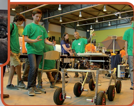
Accro-Sciences 2015 : tout au long de l'année, des équipes d'élèves élaborent un projet scientifique ou technique avec l'aide d'ingénieurs/chercheurs. A la fin de l'année, un grand rassemblement est organisé, les équipes présentent leurs projets qui sont évalués par des jurys d'experts.

Le nombre d'actions en direction des jeunes augmente régulièrement, surtout sur la découverte des métiers et de l'entreprise.