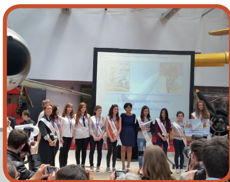
« Féminisons les métiers de l'aéronautique » Remise des prix au salon du bourget, en compagnie de la ministre de l'Éducation nationale.

L'une des premières missions du pôle REE a été de mettre en place un comité local école entreprise (CLEE) par bassin de formation, permettant ainsi de faciliter le rapprochement de l'école et du monde économique dans les territoires. La particularité de ces CLEEs réside dans une co-animation (monde économique et EN). L'octroi en 2011 de Fonds Sociaux Européen (FSE) a permis au pôle de lever les barrières financières liées aux actions menées sur le terrain. Ceci a apporté une réelle plus-value aux actions conduites dans l'accompagnement du projet d'orientation des jeunes, dans le cadre du Parcours de Découverte des Métiers et Formations (PDMF).